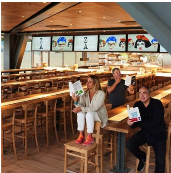
ZA, café littéraire