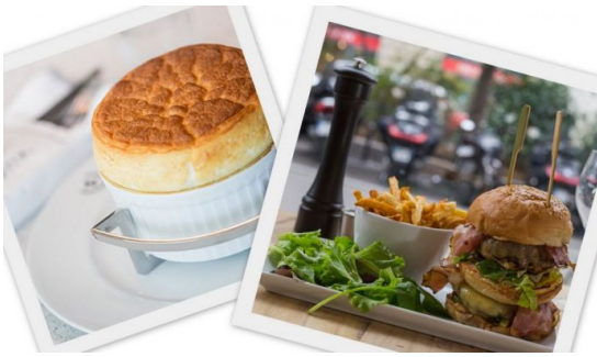
Le soufflé de Champeaux (à gauche), le burger de BBQ Bistrot (à droite)