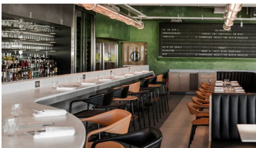
Le restaurant Champeaux